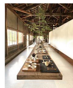
NOTA_SHOP 公式Instagram @nota_shop