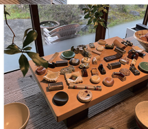
土鍋ごはん&CAFE 睦庵 公式Instagram @shigaraki.mutsuan