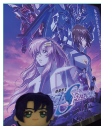
アスラン・ザラと共に初日上映へ

こんにちは、おすぎです。いかがお過ごしでしょうか？ 約20年ほど待った、「ガンダムSEEDシリーズの話」をしようと思います。