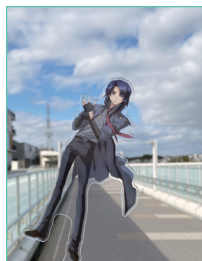
推しキャラと撮影できる優れもの購入

とうとう「ガンダムSEED FREEDOM」が公開されましたね。私と同じくずっと待っていた方もいらっしゃると思います。長かったですね。直前までほんとにやるのかな？と信じられない所がありましたが、今は情報過多で嬉しい悲鳴です。夢のようだ、と毎日過ごしています。UEDAのSEEDオタクも盛り上がっています。初日、朝早くから劇場に向かったのですが、ガンプラ限定先行販売で並んでいる列に並び、久々のこの「感じ」に高揚感を抑えられませんでした。本編開始すぐ嬉しすぎて泣いてしまいました。なにも物語が始まっていないうちに…。そういうことありますよね。ネタバレになるので、内容には触れませんが、とにかく最高でしたね。これは何回も見たいやつ。4DXも行きましたが、最高。こんなに動く4DX初めてでした。まだご覧になっていない方は是非勧めたいのですが、なんせ続編なので、ハードルが高いと思われるかもしれません。ガンダムSEED48話、ガンダムSEED DESTINY50話あります。でも！スペシャルエディションとして、三部作と四部作にまとまったものもありますので、比較的入りやすいのではないかと…なんなら40分くらいでまとまったものも公式YouTubeにあります。なので！今！おアツいうちに！是非！