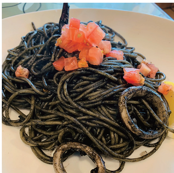
「真っ黒でも美味しい！」

パスタ好きの方も大勢いらっしゃると思いますが、私の大好きなパスタは『イカスミ』のパスタです。イカスミには、ビタミン B2 やビタミン E が含まれているようで、細胞の再生やコレステロール低下を促すようです!!