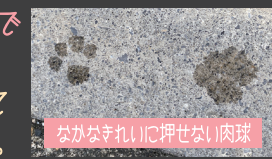
なかなかきれいに押せない肉球

く・や・し・す・ぎ・るっということでは会社の入り口でヤラセ的な感じでぺったんしてみました。あれ？むずかっ！そしてわ・か・り・に・く・い、、、