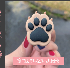
傘にはまりなかった肉球

傘につけようとしたら、、、傘先が太すぎてはまらない！！なんてこと！！傘を変えなければ！だって使いたい！せっかく雨が降ったのに！！うきうきで雨降るの待ってたのに！