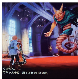
2025年 プレステ Battle BGM